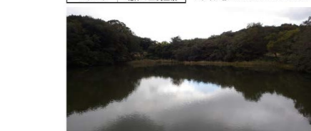
N o . 5 堤体の上流全景 ファイル名 : 2344600311311125-03.JPG