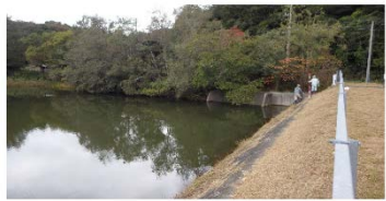
N o . 1 堤体の上流側 ファイル名 : 2344600311311121-02.JPG