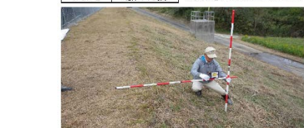
N o . 3 散水施設 ファイル名 : 2344600311311123-01.JPG