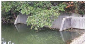
N o . 4 洪水吐 ファイル名 : 2344600311311124-02.JPG