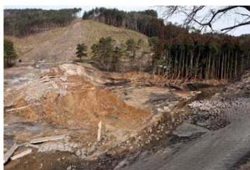
堰堤の右岸が決壊