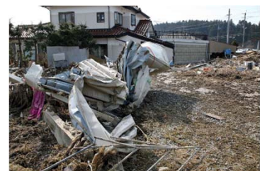
洪水による建物の被害