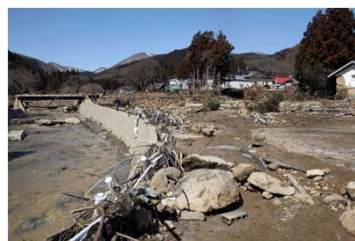
洪水による橋の被害