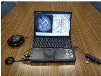
全方位カメラ機器