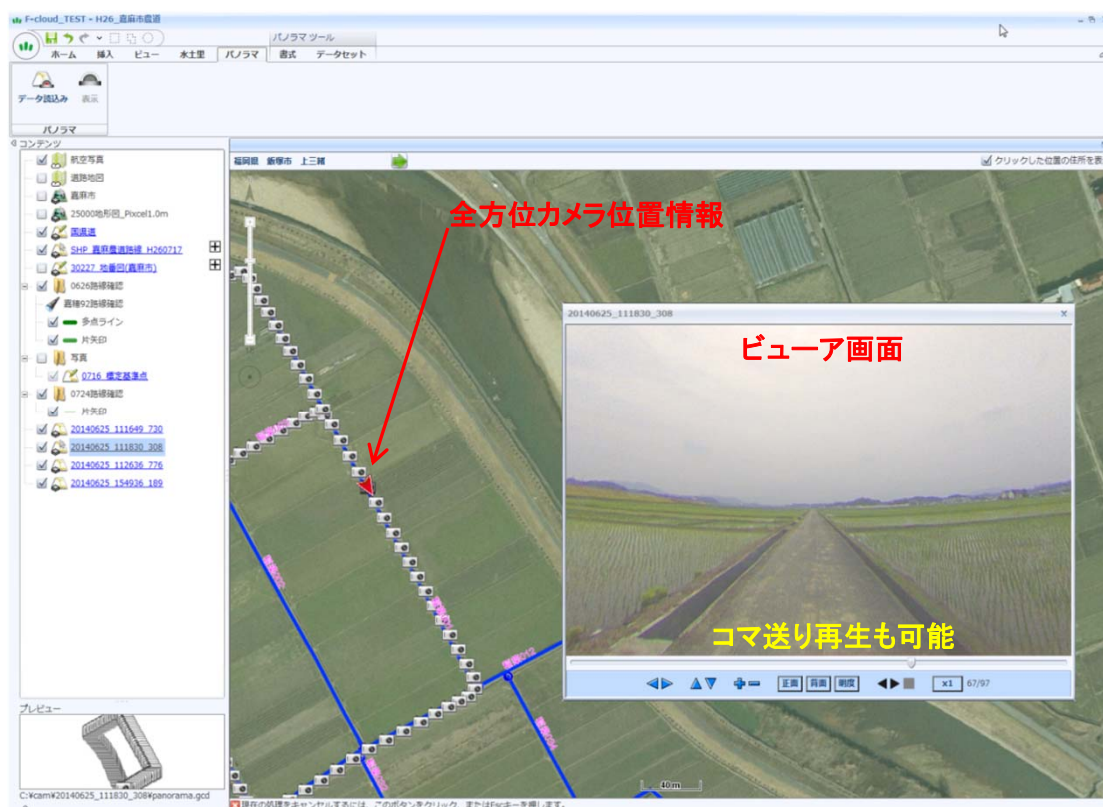
水土里情報システム画面