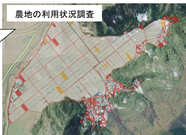
農地の利用状況調査

他の機関が行う現地確認等において、既に確認されている農地を調査対象から除外することにより、効率的な調査が可能となる。