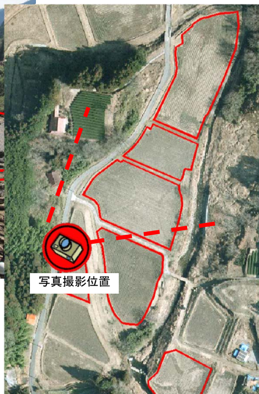
災害査定対象農地