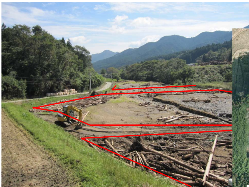
台風により被災した農地の状況

農地地図情報のデジタルオルソ画像を基に作成されている農地筆の情報を活用することで、災害査定における被災前の形状把握や求積が容易となり、煩雑な現地測量及び図化等の作業軽減による簡素化が可能となる。