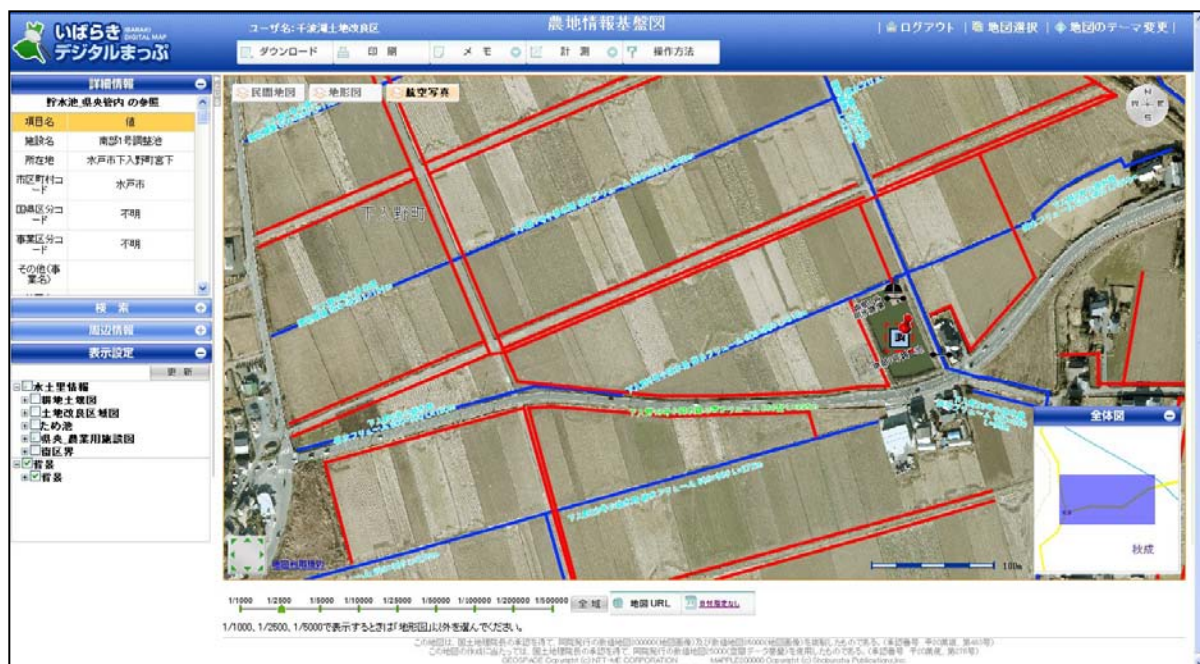
デジタルオルソ画像の上に農業用排水施設図を表示