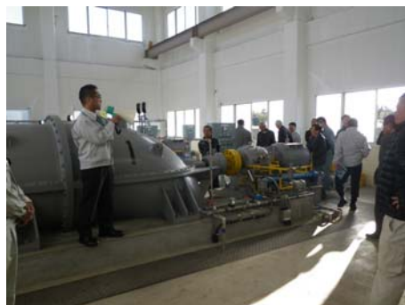
中新田排水機場での研修

圧力タンク方式とインバータ方式を併用した加圧ポンプの揚水機場の維持管理を実例に掲げ、費用をかけ過ぎない有効な保守点検についての考察が発表されました。また、実演を交えた排水機場の点検方法等の説明においては、日頃の運転管理に従事している出席者からは、洪水被害に直面した経験をもとにした質問が多く出されました。