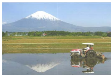
御殿場かがやき土地改良区受益地の代掻き風景