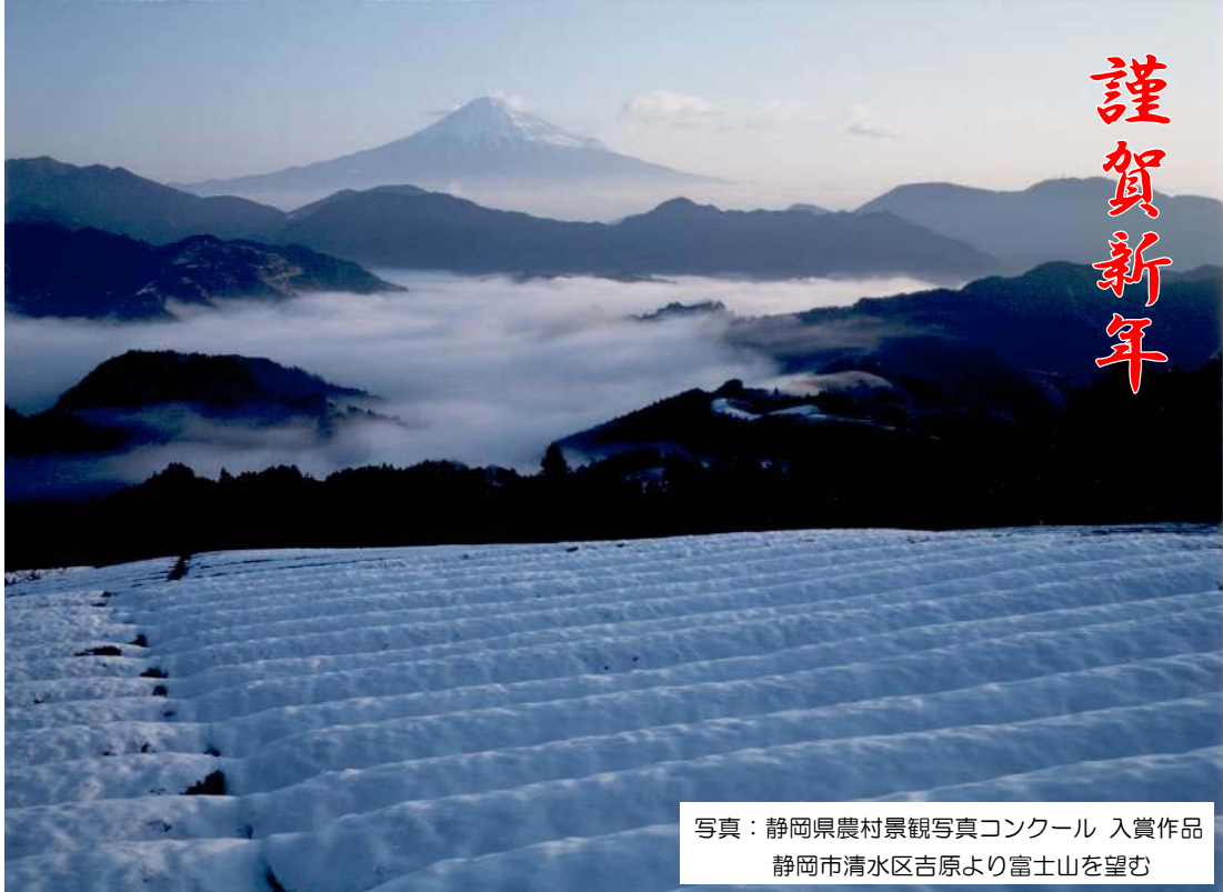
写真：静岡県農村景観写真コンクール 入賞作品 静岡市清水区吉原より富士山を望む