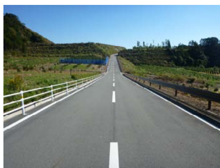
東西を結ぶ幹線道路