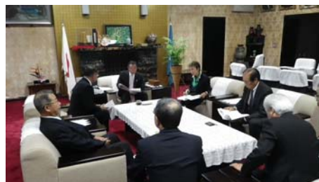
多摩県議会議長と伊藤県議会副議長への提案要望活動

平成 27 年度に向け、農業を若い新規就農者が働く産業にする、農地を集積する、所得を確保する、という方向性を重視した取組を強化すべき内容と新たに取り組むべき内容について、下記の 4 項目にわたり要望書を提出しました。