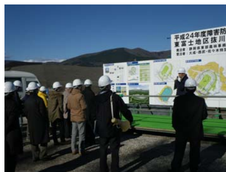
抜川調節池の工事現場の見学

研修会には市町、土地改良区等から役職員約 40 名が参加し、土地改良区等の会計事務の取扱いや個人情報の保護、公共工事の前払保証及び契約保証、農業用水利施設の補修等の講義を受けるとともに、東富士演習場周辺障害防止対策により整備中の抜川調節池（総容量約 643,000m 3 ）の工事現場を見学しました。