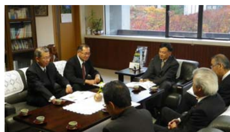
難波副知事への提案要望活動