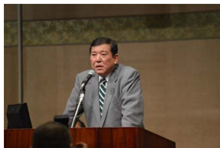
挨拶する石破地方創生担当大臣

平成 26 年 11 月 25 日（火）に、東京都千代田区平河町の砂防会館別館 1 階シェーンバッハ・サボーにおいて、全国の農業農村整備関係者約 800 名が一同に会し、現下の情勢を共有した上で、農業農村整備の一層の推進を図っていくことを目的に「農業農村整備の集い」が開催されました。