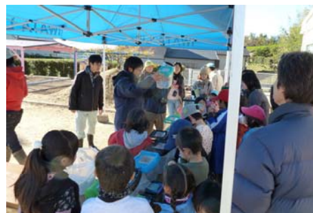
磐田用水東部土地改良区の学習会の様子