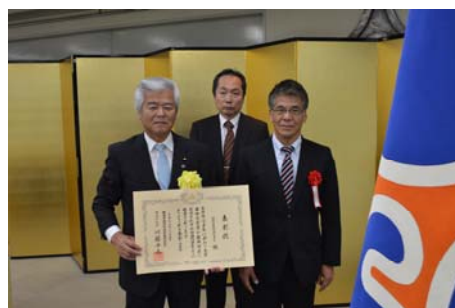
磐田用水東部土地改良区永田理事長（左側）と長島事務局長（右側）